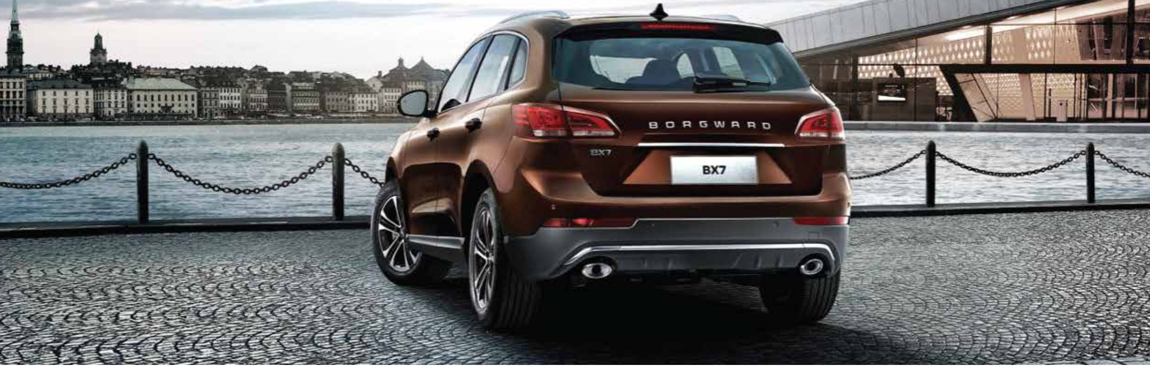
أندرز وورمينغ- بورغوارد نظام أندرز وورمينغ الذكي I-AWD Borgward Intelligent AWD